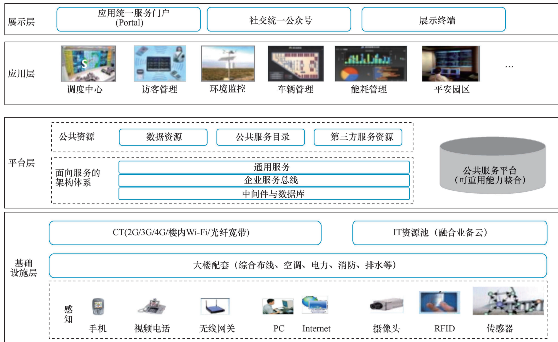
图1 智慧园区体系结构

物联网是通过各种信息传感设备，按约定的协议，将任何物品与互联网相连接，进行信息交换和通信，以实现智能化识别、定位、追踪、监控和管